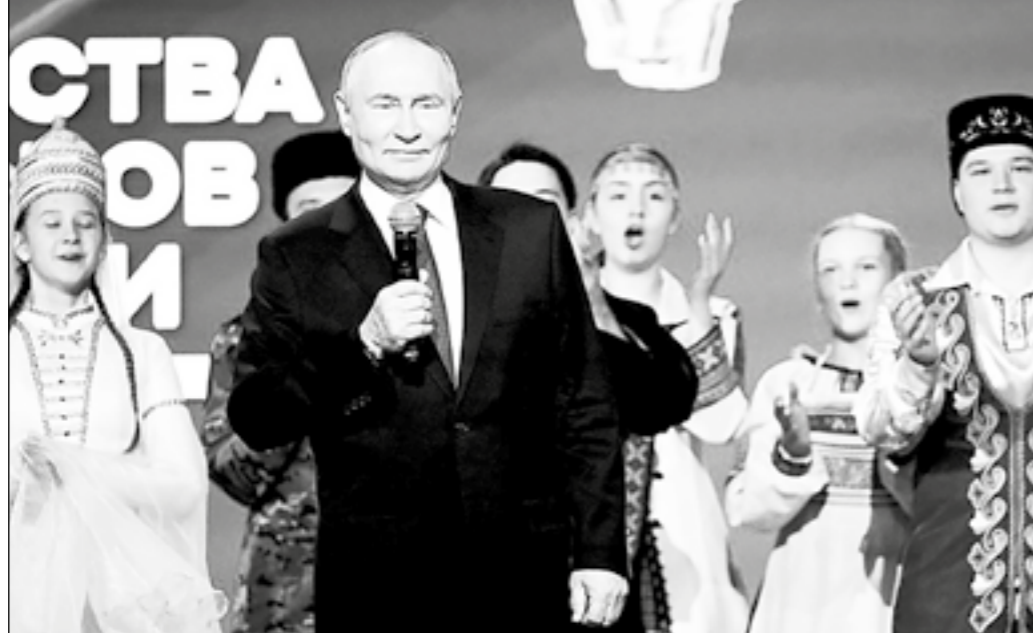
ПУТИН Владимир аугагхаьква рацзакыра а-Сквш глахьтыт

МЕДИНСКИЙ Владимир , Россия аугаг рартист ЦИСКАРИДЗЕ Николай , СВО аветеранкьва, адунейла йбергьлы спортсменкьва. – Россия аугагхаьква рацзакыра а-Сквш хькьрал абзагагьчва хьхьазла магын ду зму гланшарата йгГлхьадзит. Хара уагхаьвала, динла тшальхьымкуата ари асквш зымгьвагы йшхьзынарху хлхьвит. Россия аугагхаьква рацкьп хькьрал ду ацзакыра йшачуа йгы уахьчьва агьргьахьыгьы «Россия» уагха Квта апны ахьазыкь йгькьвшум. Угы йалахит йагьу аугагхаь цаскьва, акультура, хькьрал зрыбагьыауа айгГайракьви агатгаракьви уахьчьва араь йагГадьрбауа. Йшбергьлы апшта, уагхаьтата 194 Россия апны йбзазит. Аут дасулакьгы рхьа йахьвитта рыбьшакьви рцаскьви рхит, ркультура шбайу гадьрбит. Хара зымгьва хьызлагарьлырклгьлауа хлхьл пщдза, хькьыль-акьшара, хлацзакыра рацкьп. Скьшыкь пхьадзара йнадзауа хькьрал атурых йгГанахьит хуагхаьква райгьвари раш-