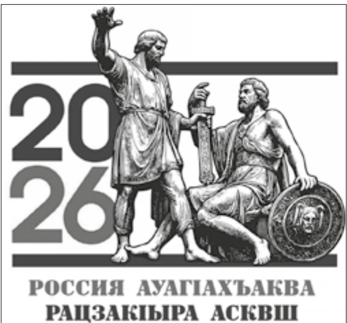
анузаргьванхара, заджьы йкультура глауьынгуа уаналагара аган аклвп ави ангГаджькьвылуа. Кьарча-Черкес аугагхаьквагы ави аклвп хьшбза-

дыргалыз арыпхьара программа алачпан. Чкьлынырла йгарыныат йбергьлы аьвлара уыскьыгьгьчва, аполитикьва, артистка. Аугагхаьква рацзакыра а-Сквш аглахьтла йлаз астуденткьва рылакьвала йырбат йгы йырглат аугагхаьква райгьвари рацтанькьвауа араьхьрат аштакьва йгГартыцыз рыкьлагьчва йрархьуан. – Путин Владимир – «Сара сдэгьстанп, счанчп, сингьыцп, смордвинп, сосетинп!»-хьва